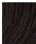
R6 Castano medio