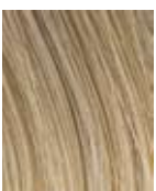
R14/88H Biondo chiaro