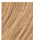
R25 Biondo medio