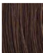
R6/30H Castano medio ramato