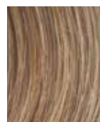
R14/25 Biondo caldo