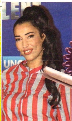
A sinistra la cantante Nina Zilli . Sotto, invisibobble, l'elastico che non spezza i capelli (6 euro, 6 pezzi) e il ferro Curi Revolution CIG06 di Remington (69 euro).